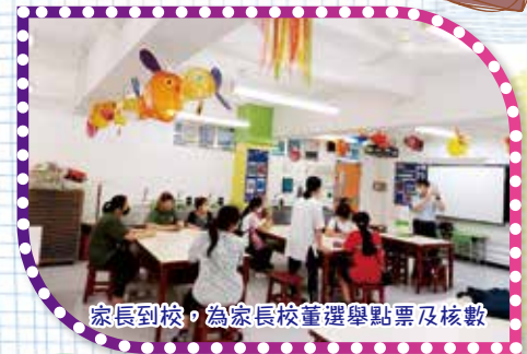
家長到校，為家長校董選舉點票及核數