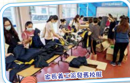
家長義工派發舊校服