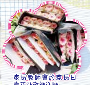
家長教師會於家長日賣花及敬師活動