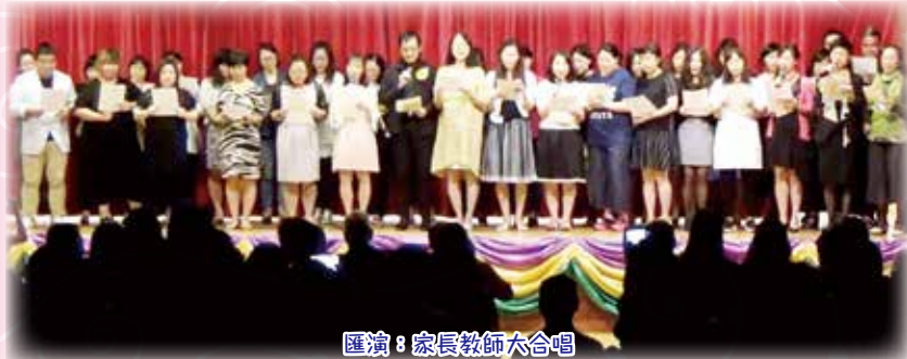
匯演：家長教師大合唱