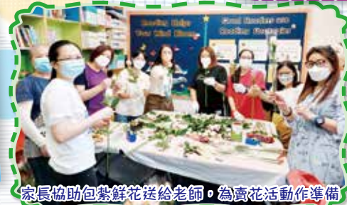
家長協助包裝鮮花送給老師，為賣花活動作準備