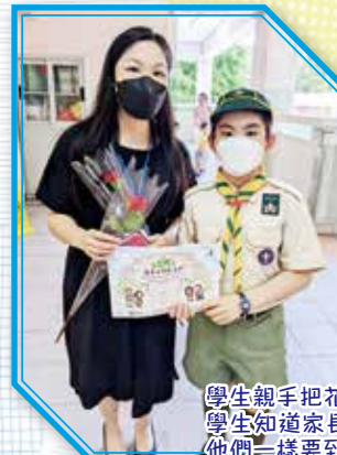
學生親手把花送給教師，表達對老師的尊敬。學生知道家長擔任家長義工時，都表現得很興奮，還說媽媽好像他們一樣要到學校上學，家長亦是學校的一份子。