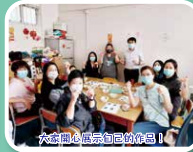
大家開心展示自己的作品！