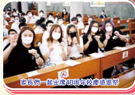
家長們一起出席40周年校慶感恩祭