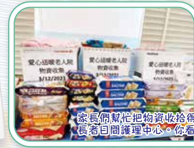
家長們幫忙把物資收拾得很整齊，送到香港聖公會慈雲山長者日間護理中心。你看！長者們收到滿滿的愛多高興！