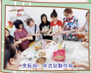
烹飪班：中式包製作班