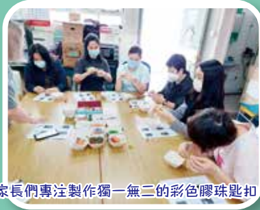
家長們專注製作獨一無二的彩色膠珠匙扣。