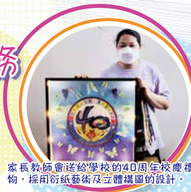
家長教師會送給學校的40周年校慶禮物，採用衍紙藝術及立體構圖的設計。