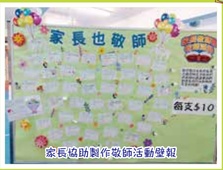
家長協助製作敬師活動壁報