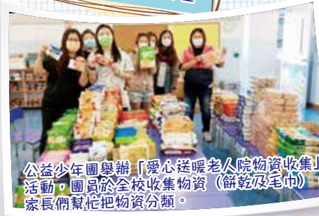
公益少年團舉辦「愛心送暖老人院物資收集」活動，團員於全校收集物資（餅乾及毛巾），家長們幫忙把物資分類。