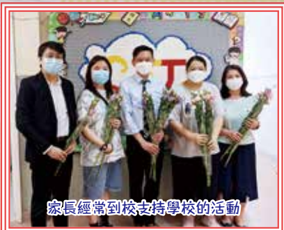
家長經常到校支持學校的活動