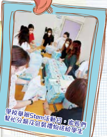
學校舉辦STEM活動日，家長們幫忙分類及包裝禮物送給學生