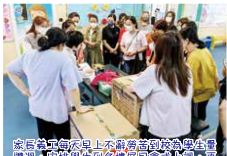
家長義工每天早上不辭勞苦到校為學生量體溫，安排學生到各樓層早會或上課，更為學生分發檢測包呢！